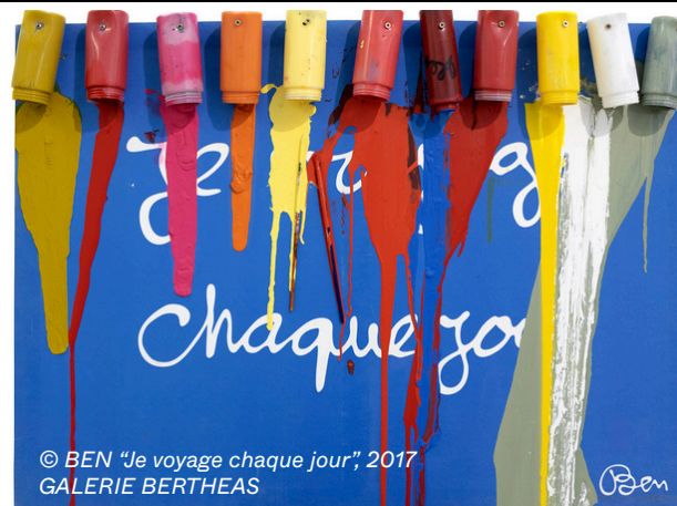
© BEN "Je voyage chaque jour", 2017 GALERIE BERTHEAS