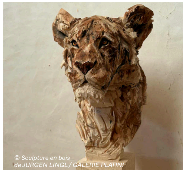
© Sculpture en bois de JURGEN LINGL / GALERIE PLATINI